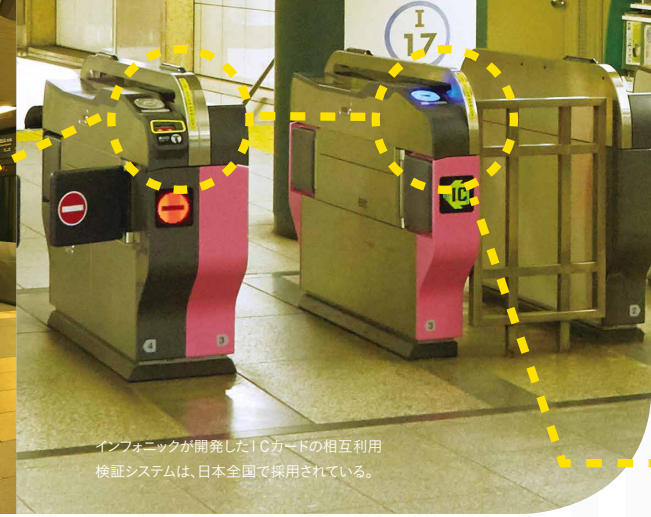
インフォニックが開発したICカードの相互利用検証システムは、日本全国で採用されている。