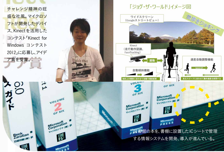
図書館の本を、書棚に設置したICシートで管理する情報システムを開発、導入が進んでいる。