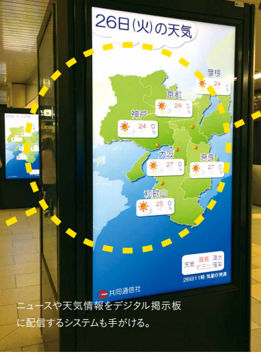
ニュースや天気情報をデジタル掲示板に配信するシステムも手がける。