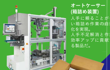
オートケーサー (箱詰め装置) 人手に頼ることが多い箱詰め作業の自動化を実現。 人手不足解消と作業効率アップに貢献する製品だ。