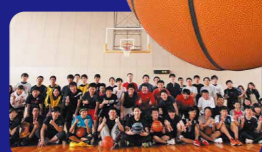
社内ではサークル活動もさかん。 職域を超えた交流がある。

本社：京都市左京区聖護院山王町44 TEL：075-771-4141 http://www.ishida.co.jp 従業員数：1,438名 創業：1893年5月 設立：1948年10月 主な事業内容：計量、包装、検査、情報、通信表示、これらの技術をベースにした製品の開発と製造、保守に関する業務全般。