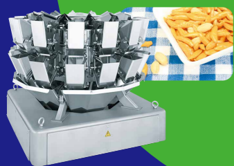
組み合わせ計量器 様々な食品の「定量計量」を瞬時に 行う世界シェアトップを誇る製品だ。