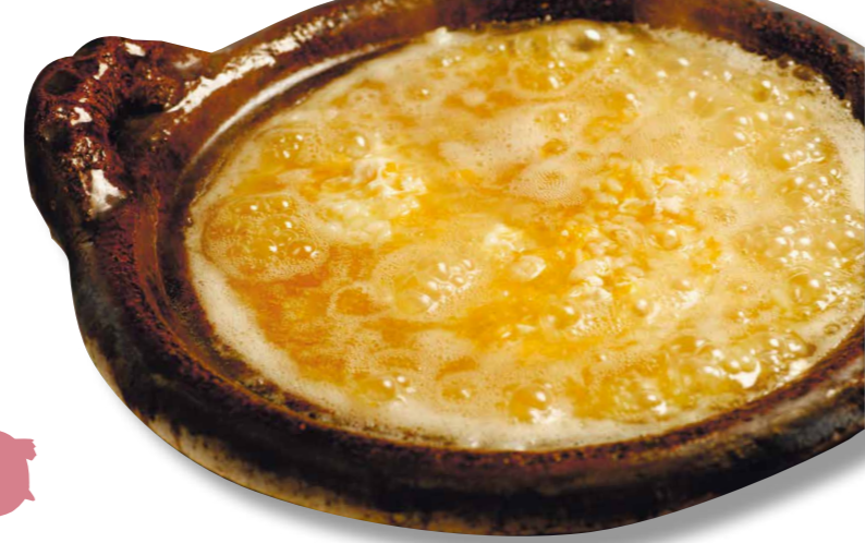
志賀直哉や川端康成の小説にも登場した、すっぽん料理の老舗。メニューはコース2万4000円のみ。

事業本部:京都市上京区下長者町通千本西入ル六番町 TEL:075-461-1775 http://www.mt-security.co.jp/ 従業員数:10名 設立:昭和58年7月に株式会社化(創業340年) 主な事業内容:すっぽん料理 大市の運営