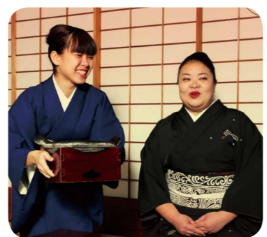
着物は貸与され、着付けも、美しい所作も教えてくれる。日本の素晴らしい文化を、働きながら体得できるメリットがある。

で、安心して下さいね。」 柱には新撰組の刀傷が残る。創業当時と変わらない姿の京町家で、歴史とともに着物で働く。本物の味に魅かれてここ数年は海外からの富裕層客が増え、京都観光の最先端の場でもある。 「観光業や接客業に興味があって、お客様をおもてなしたい人、英語や中国語に興味のある人も大歓迎です。」 まずはアルバイトからの勤務もOK。正社員登用への道も開かれている。