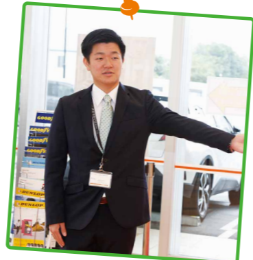
愛車はRAV4、「ゆったり乗れてカッコイイ」のがお気に入り。休日は毎週ドライブへ。

敬語が使えない、電話が早口になる、よかれと思ったことが裏目に出る。しかも同期が車を何台も売り始める。焦った。そんなとき、上司が「大丈夫か?」と声をかけてくれ、言われたのが「焦るな、1年目の今は売らなくていいんだよ」の言葉だった。