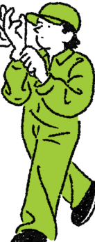
工学部交通機械工学科 自動車工学コース2年