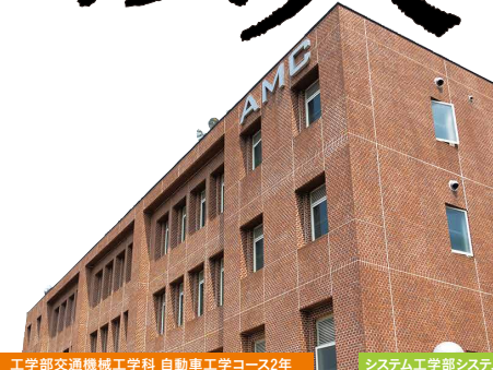
工学部交通機械工学科 自動車工学コース2年

※1 2025年4月より工学部の募集を停止し、システム工学部としてリニューアル。